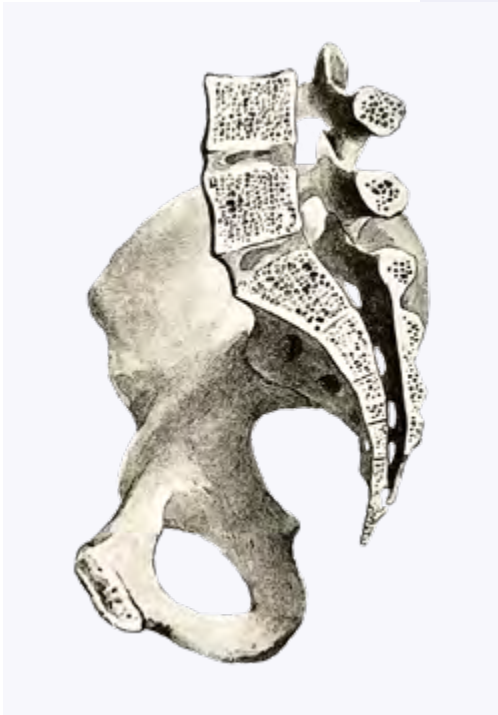
Weibliches Becken: Medianschnitt, rechte Hälfte, von links. (Spalholz, 1900)

Welche grundsätzlichen Aussagen über die Beschaffenheit des harten Geburtsweges und folglich über die Geburt die bewährte optische und abtastende Methode der Beckenuntersuchung liefern kann, erklärt unser Text zur „Äußeren Beckenpalpation“.